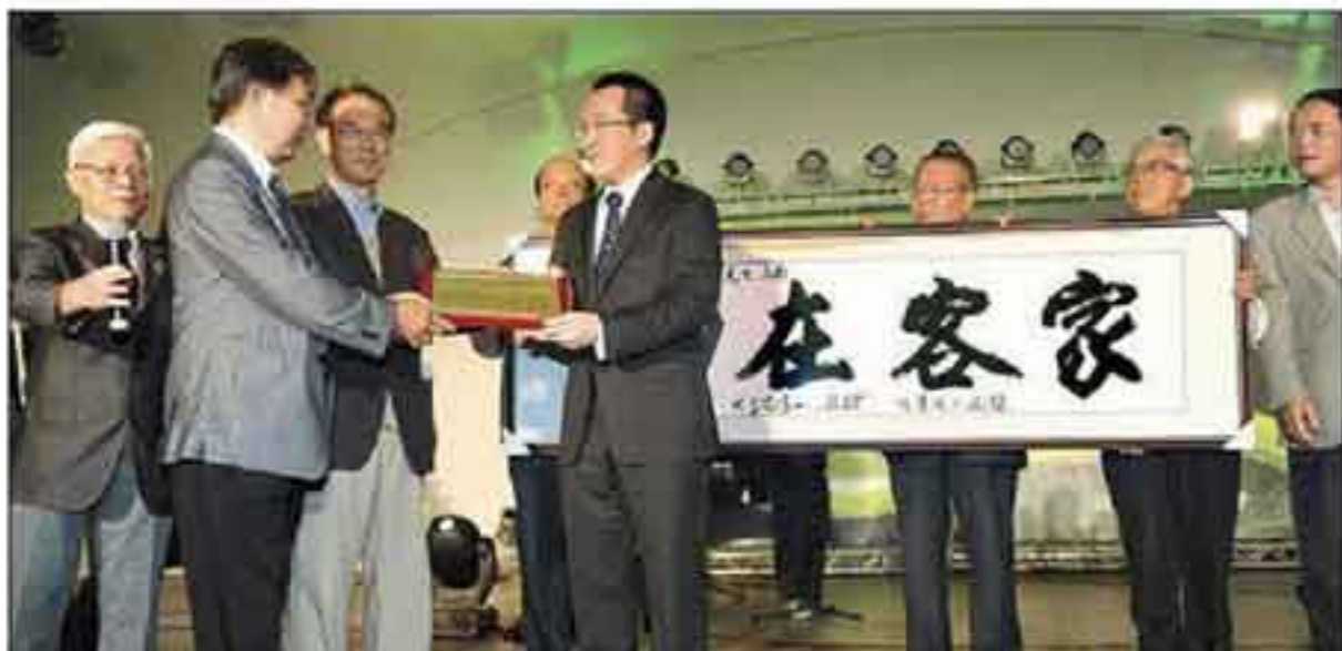
客家團體頒發客家貢獻獎給陳前總統，由兒子陳致中（前右）代為接受。

近兩百位客家籍菁英包括客家界大老鍾肇政、李喬等人聯名頒給阿扁「客家貢獻獎」，以表彰陳水扁對客家文化的貢獻，這項獎項由陳水扁的兒子陳致中代為領取。