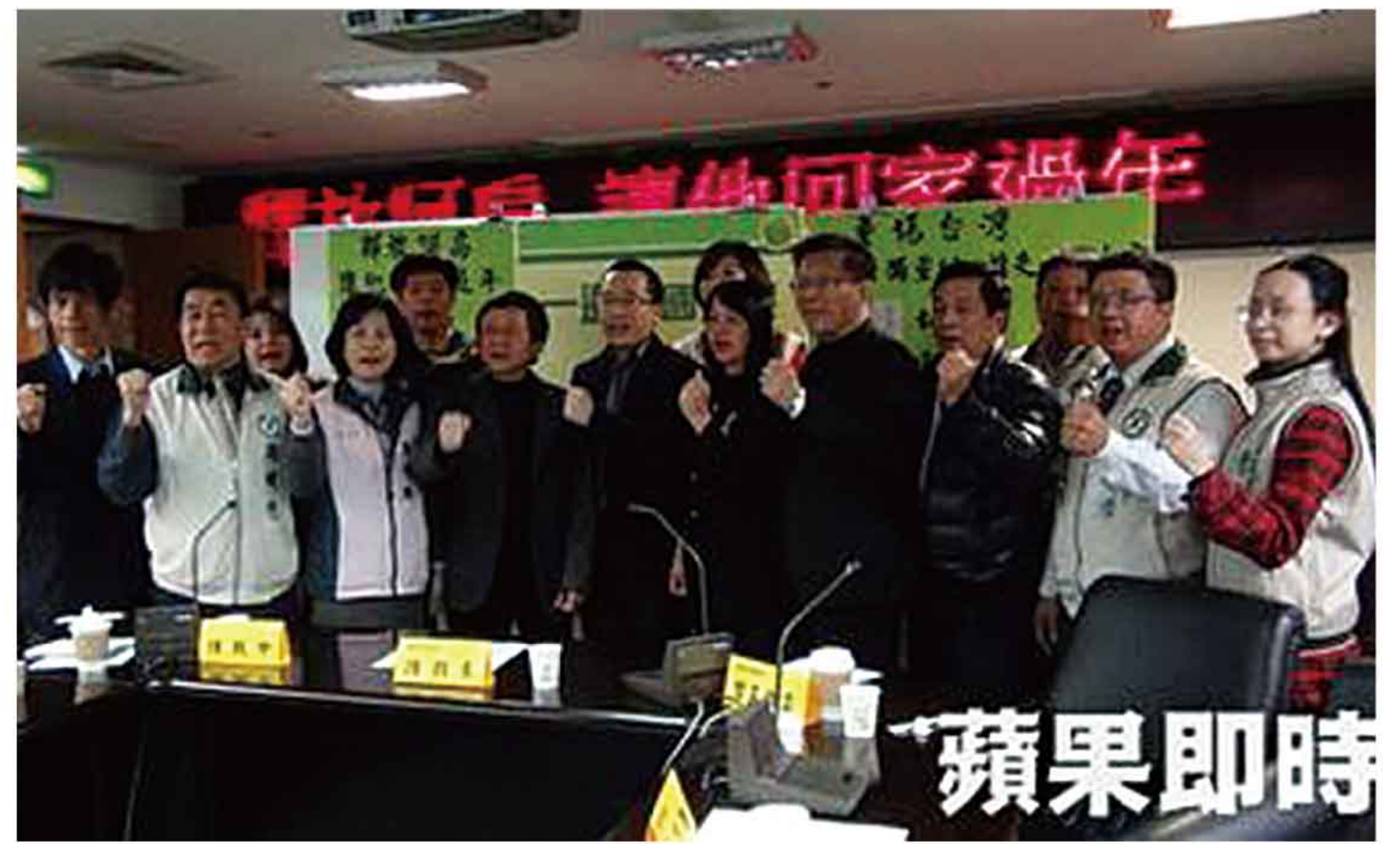
台南市一邊一國連線公開宣佈五位新成員加入，總數達到十七人，陣容旺盛，影響力更加壯大。