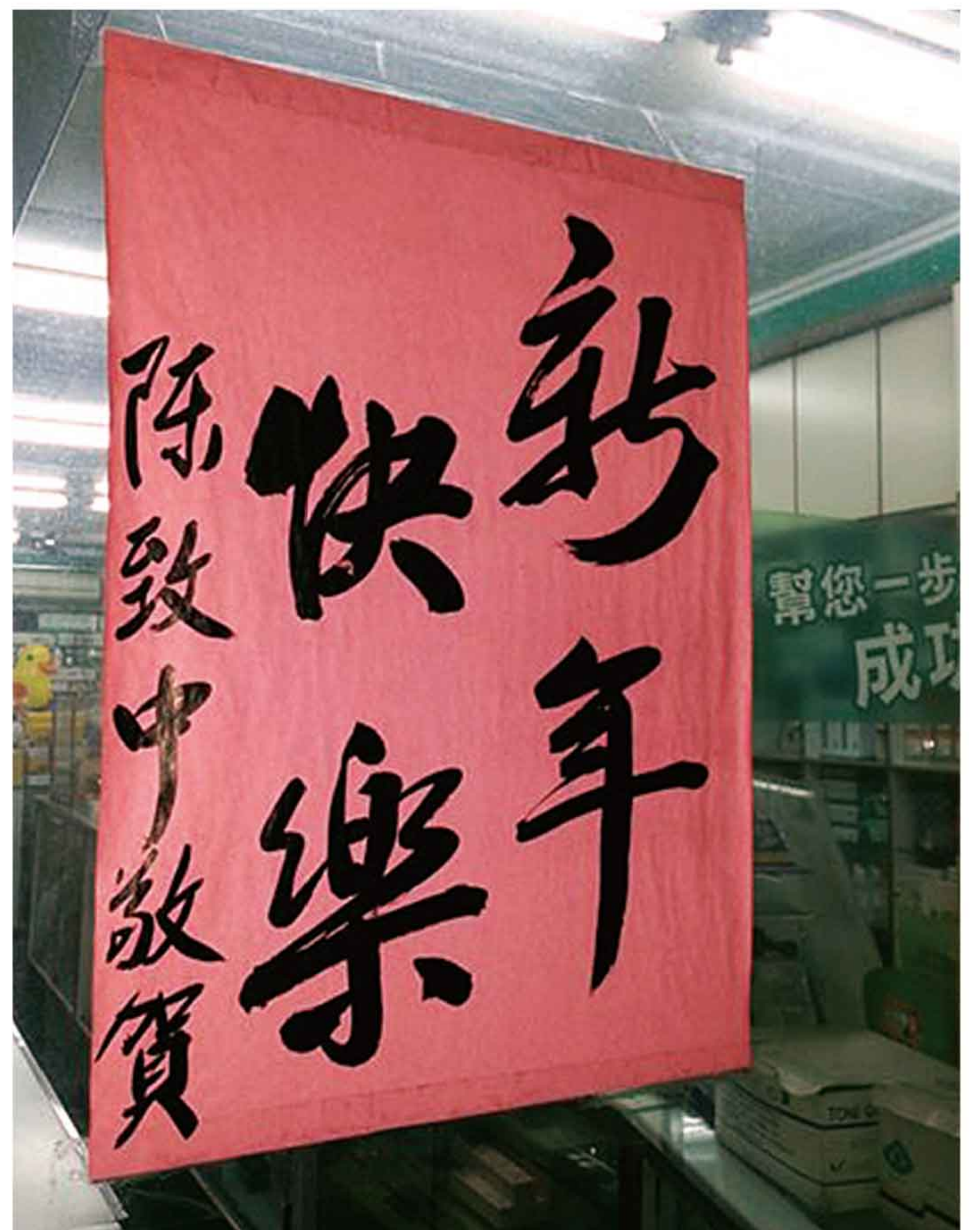
這是致中選區某藥房門口，2013年的春聯一直貼到2014年，支持者揪感心喔！