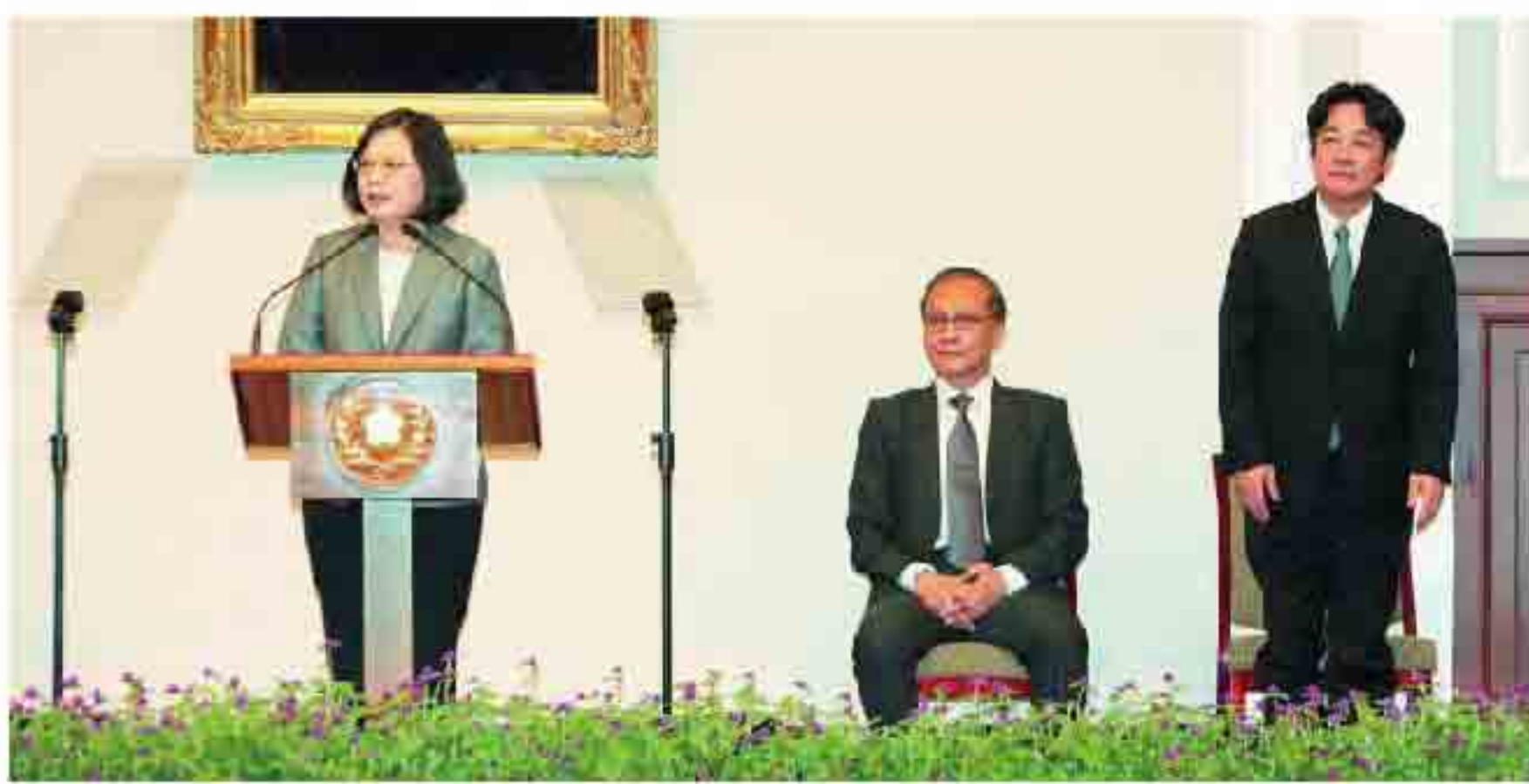
游盈隆說，蔡英文此時此刻任命賴清德出任閣揆，是打出了一張王牌，下了一步絕妙好棋，一舉數得。

全內閣時代的結束，而接下來是賴清德內閣時代的開始。蔡英文此時此刻任命賴清德出任閣揆，的確是打出了一張王牌，下了一步絕妙好棋，一舉數得，但也曠日廢時很久了。在賴清德方面，從考慮出任總統府秘書長、國安會秘書長、行政院副院長或參選新北市長，一直到最後獲得行政院長職位，對他而言算是短期內所有選擇中最好的選擇。蔡英文會算，賴清德也會算。深謀遠慮，本是一個好政治人物的必要條件，不能深謀遠慮的政治領袖才是社會的不幸與災難。尤其是，當炒短線的政治算計取代為國為民的深謀遠慮的時候。